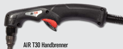
AIR T30 Handbrenner