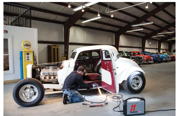
Fahrzeugreparatur und -umbau